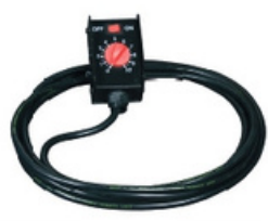
Optional REMOTE CONTROL 99810016 - 10 m 99810013 - 4 m