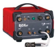
Optional BOX HF 99900127